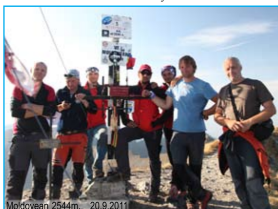
Moldovean 2544m, 20.9.2011

Po celonočnej jazde cez Maďarsko a Rumunsko sme dorazili do pekného strediska Balea Lac, kde sme sa ubytovali v parádnej stanici horskej služby. V stredisku je aj známa Čaučeskova chata kde býval na svojich poľovačkách. K stredisku vedie známa Transfargašská cesta, ktorá pripomína cestu cez Smutnú dolinu do Žiarskej doliny, ale vo väčšom a cez sedlo je tunel. Na druhý deň ráno sme vyrazili na hrebeň Fagarašu. Milo nás prekvapilo veľmi dobré značenie chodníkov. Prešli sme časť hrebeňa aj s najvyšším vrcholom, spávali sme pod holým nebom pri plesách, v Rumunsku je to dovolené. Charakter hôr pripomínal