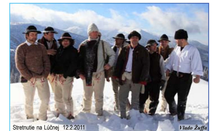
Stretnutie na Lúčnej 12.2.2011