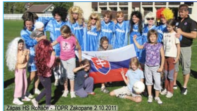
Zápas HS Roháče - TOPR Zakopane 2.10.2011

Na 23. ročníku turnaja Horských služieb ktorý sa tento