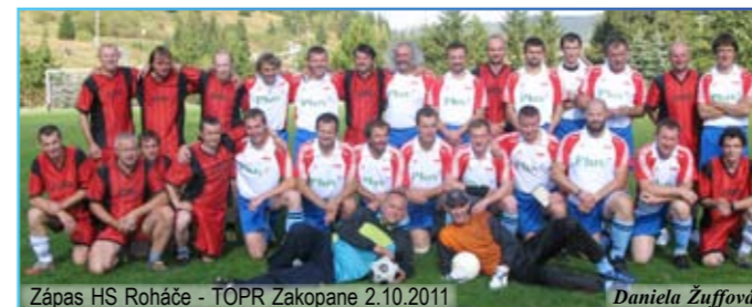
Zápas HS Roháče - TOPR Zakopane 2.10.2011