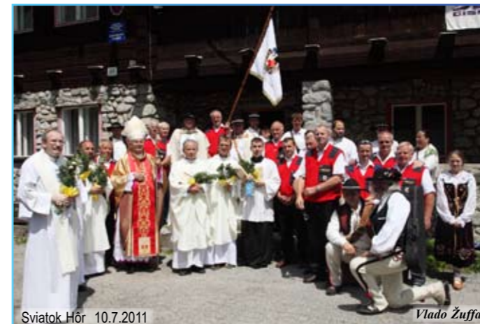
Sviatok Hôr 10.7.2011