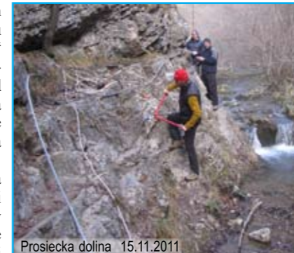
Prosiecka dolina 15.11.2011

Pod vrcholom Sivého vrchu smerom do sedla Pálenica sme dali novú reťaz a kramle v strmom komíne v Radových skalách. Na jeseň sme opravili prvú reťaz od Jamnickeho sedla a tiež reťaz