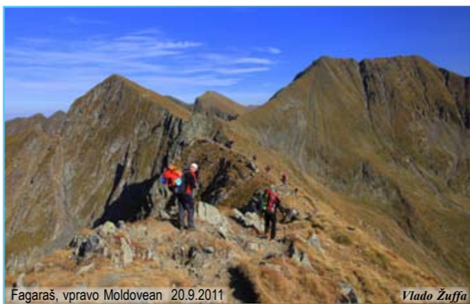
Fagaraš, vpravo Moldovean 20.9.2011

Fagaraš je najväčšie a najrozsiahlejšie pohorie v Rumunsku, hlavný hrebeň má vzdušnou čiarou 70 km. Nachádza sa tu aj najvyšší vrchol Rumunska – Moldoveanu 2544 mnm.