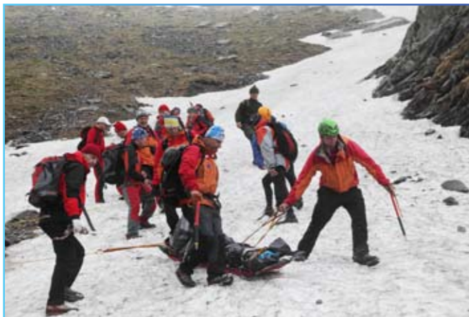
Žlab medzi Ostrým a Plačlivým Roháčom 2.6.2011