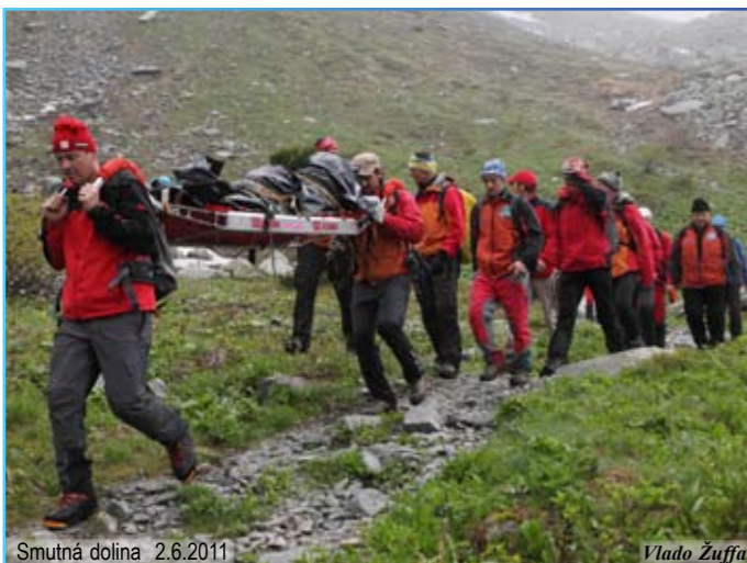
Smutná dolina 2.6.2011