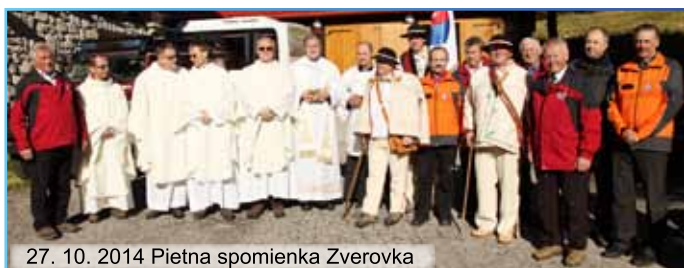
27. 10. 2014 Pietna spomienka Zverovka