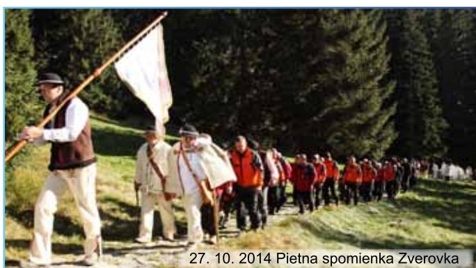
27. 10. 2014 Pietna spomienka Zverovka