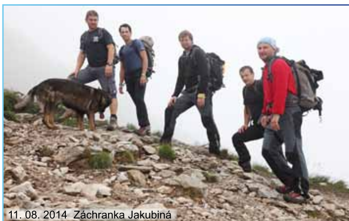
11. 08. 2014 Záchranka Jakubiná