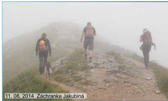
11. 08. 2014 Záchranka Jakubiná

V uplynulej zime bolo málo veľmi málo snehu. Na Zverovke sme nameľali v prírastkoch len cca 180 cm snehu, čo je hlboko pod priemerom. Takmer celý január a február nesnežilo. Skialpová sezóna to tiež poznačilo, napriek tomu v Salatínskej a Zelenej doline sa tiež robilo s obmedzením robíť celú sezónu. V Salatínskej doline sme dvakrát aj transportovali zranených skialpinistov. Naviaty sneh nám narobil starosti pred pretekmi „Bokami ZT“. Pri príprave padali lavíny, museli sme výbušnami vyčistiť svahy na trase pretekov. Počas zimy sme žiadny smrteľný úraz nezaznamenali.